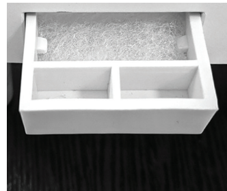
Ванночка для эфирных масел