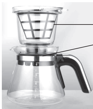
Воронка (дриппер) с фильтром