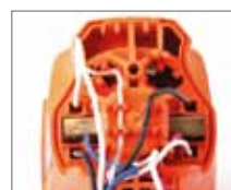
Быстрый доступ к угольным щеткам