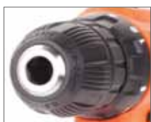
Быстрозажимной патрон для быстрой смены оснастки