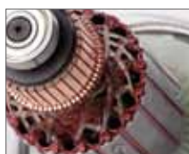
Арамидная нить для фиксации обмотки