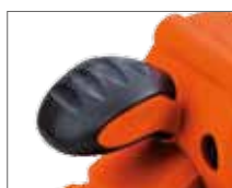
Прорезиненная рукоятка ExrtaGrip