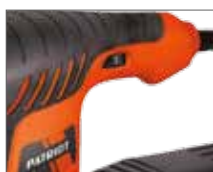
Регулировка скорости вращения