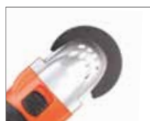
Полуциркулярный (циркулярного типа) резак по дереву