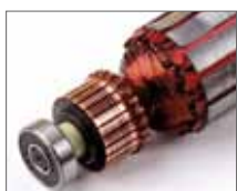
Подшипники и электродвигатель защищены от пыли