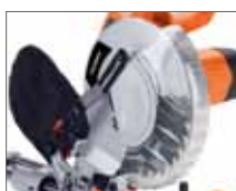
Защитный кожух на диске 255мм