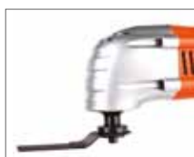
Корпус из прочного материала