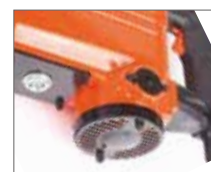
Вертикальное расположение мотора