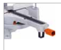
Фиксирующий винт - для быстрой установки положения поворотного стола