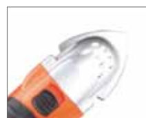
Шлифовальная плитка для шкурки