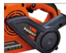
Современный эргономичный дизайн