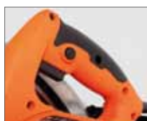
Резиновые накладки ExtraGrip