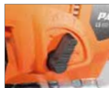
4 режима маятникового хода