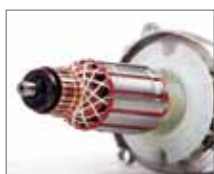
Арамидная нить для фиксации обмотки