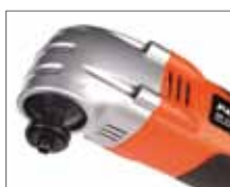
Совместим с оснасткой ведущих производителей