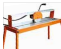
Работа с заготовкой 920мм