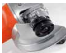
Кожух защищает оператора при работе