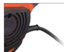
Прорезиненный сетевой кабель PATRIOT