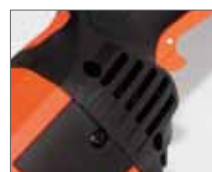
Система воздушного охлаждения двигателя