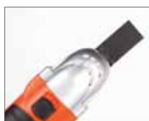
Прямой резак по дереву