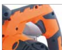
Резиновые накладки ExtraGrip