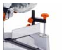
Зажимное устройство для фиксации заготовки