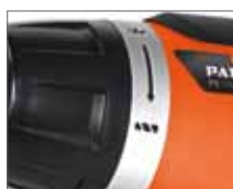
Выбор режима работы