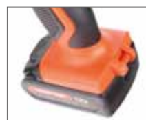
Ёмкий аккумулятор Li-Ion