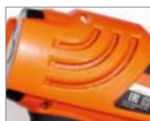
Улучшена система охлаждения двигателя