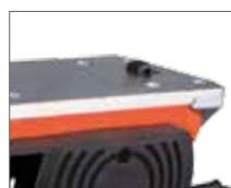
Автоматический «башмак» для безопасной работы ножа