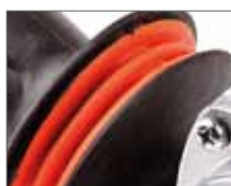
Боковая рукоятка с защитой от вибрации