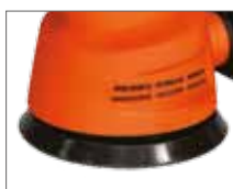
Крепление шлифовальной бумаги, на липучке платформы