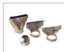
Набор насадок в комплекте