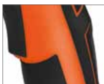
Резиновые накладки ExtraGrip