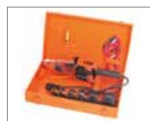
Кейс для удобства хранения