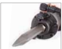
Надежное крепление долота