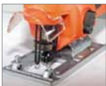
Прозрачный защитный экран