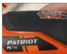
Индикатор заряда батареи