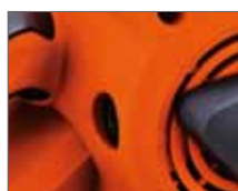
Легкая замена щёток