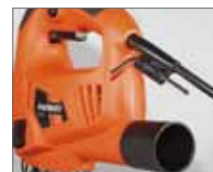
Патрубок для отвода пыли