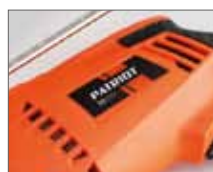
Система воздушного охлаждения двигателя