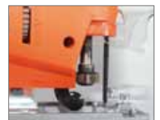
Быстрая замена пилки