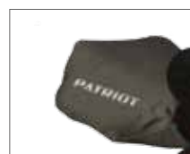
Мешок для сбора стружки