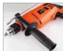
Рукоятка с ограничителем глубины