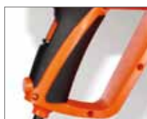
Резиновые накладки ExtraGrip