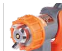
Диаметр сопла от 0,8 до 2,6 мм