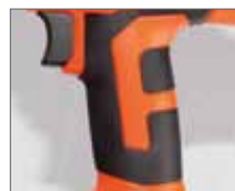
Резиновые накладки ExtraGrip