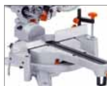
Размеченные угловые шкалы на столе