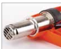
Металлическое сопло устойчиво к высоким температурам