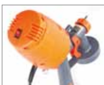
Частота вращения двигателя 28000 об/мин