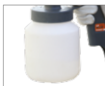
Увеличенный объем бачка для краски