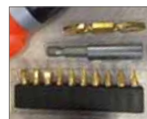
В комплекте набор насадок