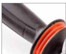
Рукоятка с виброзащитой