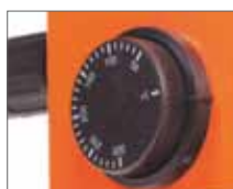
Рукоятка плавной регулировки температуры