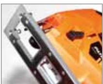
Интегрированная стальная подошва