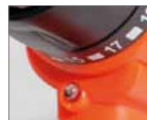
Подсветка рабочей зоны