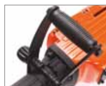
D-образная регулируемая дополнительная рукоятка