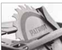
Регулировка угла пропила