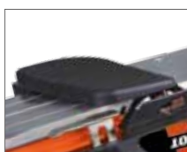
Система ножей SharpCut