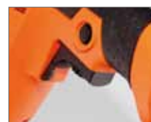
Блокировка функции изменения направления вращения