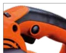
Удобная блокировка кнопки ПУСК