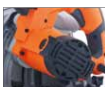
Легкий доступ к счёткам