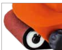
Удобная система легкой замены шлифовальной ленты