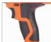
Резиновые накладки ExtraGrip