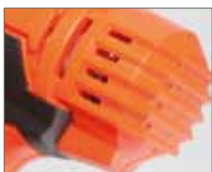
Система воздушного охлаждения двигателя