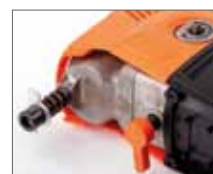
Антивибрационная система AVS