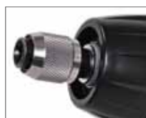
Быстрая смена оснастки