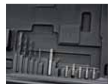
В комплекте набор бит и сверл