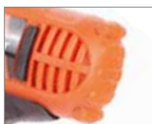
Система воздушного охлаждения двигателя