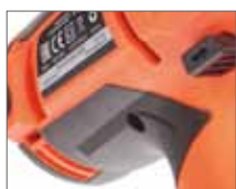
Система воздушного охлаждения двигателя