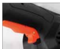
Удобная широкая клавиша пуска