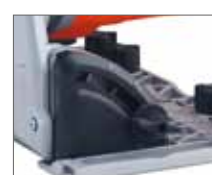
Угол регулировки от 0 - 48°