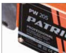
Мощный аппарат (2 кВт) обеспечивает разогрев за 2 минуты