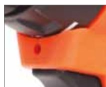
Яркая подсветка рабочей зоны