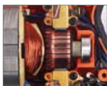
Защита электродвигателя от пыли