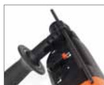
Регулируемый ограничитель глубины