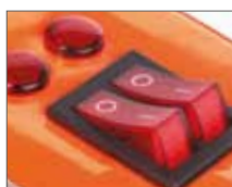
Индикаторы нагрева и подключения к сети