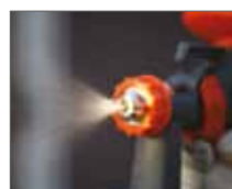
Высокая точность распыления