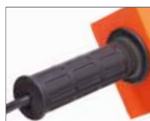
Удобная прорезиненная ручка