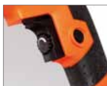
Регулировка скорости вращения