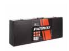
Металлический кейс для транспортировки