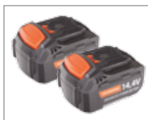
В комплекте 2 аккумулятора повышенной емкости