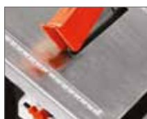
Прочное стальное основание