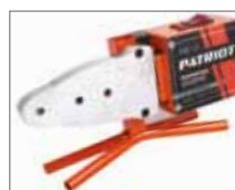
Устойчивая опора для точной работы