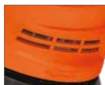
Хорошее охлаждение двигателя благодаря встроенной вентиляции