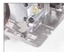
Надёжная литая платформа