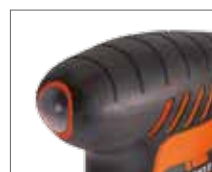
Пыле-влаго защищённая кнопка включения