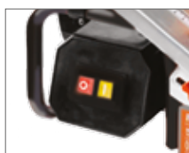
Удобный пуск и остановка станка