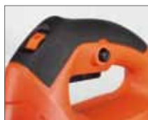
Резиновые накладки ExtraGrip