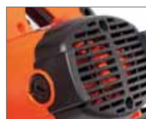
Быстрый доступ к угольным щеткам