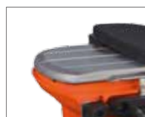
Три V-образных пазы для удобства обработки кромки