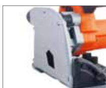
Пильный диск прикрыт защитным кожухом