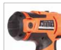
Большой крутящий момент