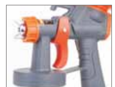
Для удобства клавиша пуска располагается на рукоятки