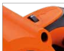
Регулировка скорости вращения ленты