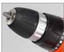
Быстрозажимной патрон для быстрой смены оснастки