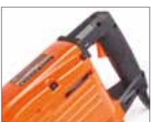
Антивибрационная прорезиненная рукоятка