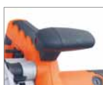
Нескользящие накладки на рукоятках