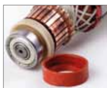
Подшипники защищены от пыли