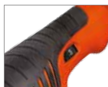
Прорезиненная рукоятка ExtraGrip