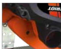
Удобная система пылеудаления