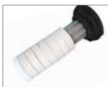
Керамическая система изоляции