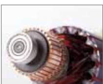
Подшипники защищены от пыли