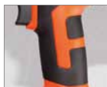
Резиновые накладки ExtraGrip