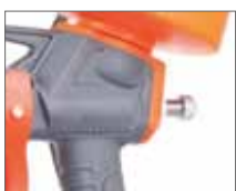
Регулятор ширины распыла и подачи на рукоятке краскопульты